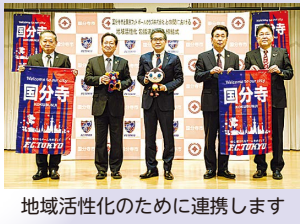
地域活性化のために連携します