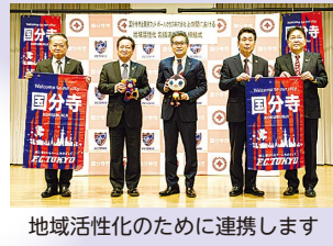
地域活性化のために連携します