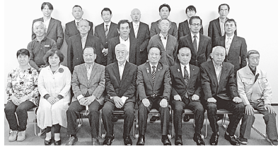
令和4年度 認定書交付式