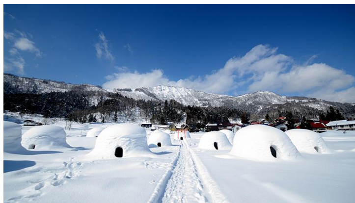
かまくらレストラン