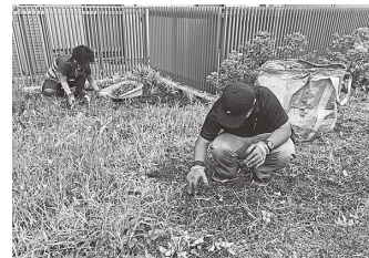
マンションの清掃やご家庭の除草作業も行います

加盟事業所 この里、どーむ、希望園、食彩工房プラスワン、ともしび工房、さつき共同作業所、ビーパス、オハナ農園、チェンジアップ、喫茶ほんだ・こだま、まほろば、市社会福祉協議会(協力団体)