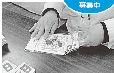
軽作業(封入・シール貼り・パソコン入力)、清掃(消毒)、接客などを行います

障害のある方と共に働き、共に支え合う社会に関して考えてみませんか。障害のある方の働きたい思いを支援し、自立と社会参加を促進するため、就労支援を行っています。