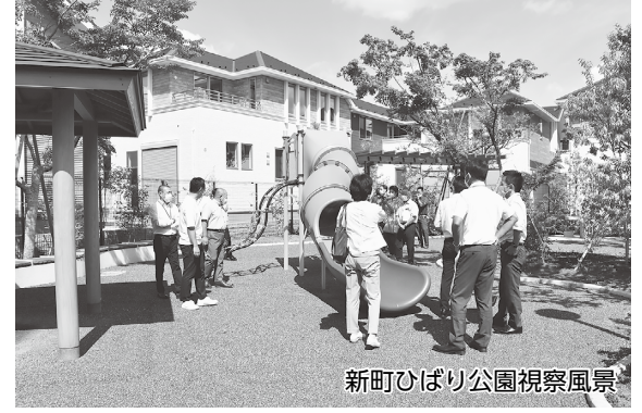
新町ひばり公園視察風景