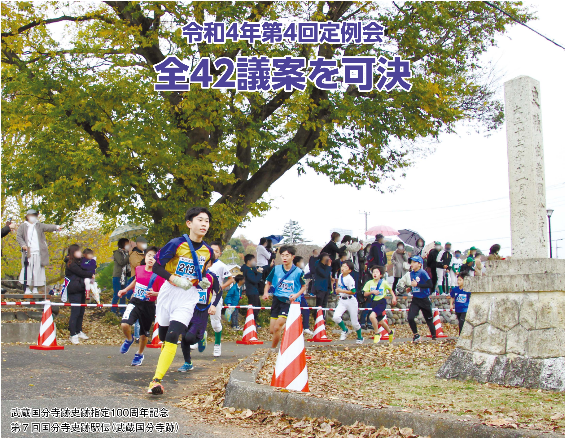
武蔵国分寺跡史跡指定100周年記念 第7回国分寺史跡駅伝(武蔵国分寺跡)