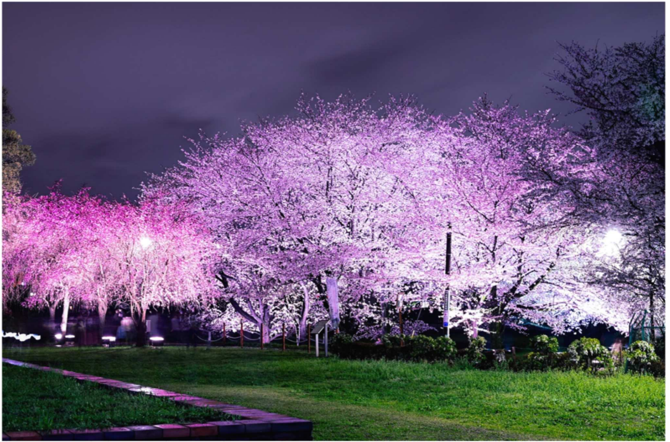
史跡武蔵国分寺跡 春のライトアップ