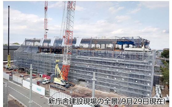
新庁舎建設現場の全景(9月29日現在)

を付けたり、見通しをよくしておくことで危険がないようにする。ぶんバスについては、歩行者動線と交差しないようなルートを検討している。