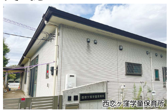
西恋ヶ窪学童保育所