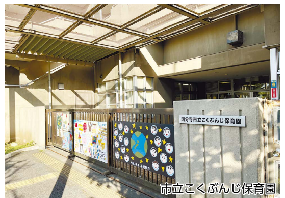
市立こくぶんじ保育園

A 現在の申込数は約750件である。多くの方に申込んでいただきたいと考えており、適時周知を図っていく。