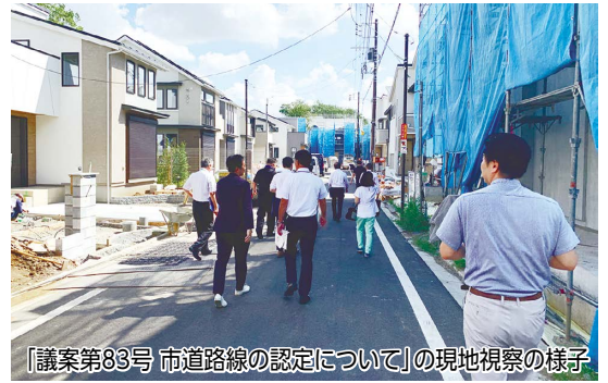
「議案第83号 市道路線の認定について」の現地視察の様子

・国分寺市耐震改修促進計画の改定と木造住宅耐震診断・改修等補助の拡充について など