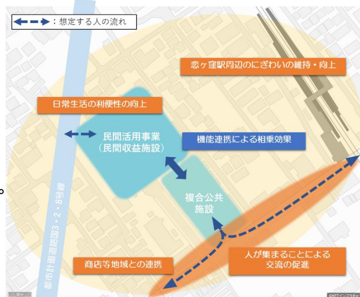
図：恋ヶ窪駅周辺の機能連携の考え方

誘導目標とする都市機能等については、恋ヶ窪駅周辺を訪れる人が、日々の買い物などの日常生活の利便性の向上につながる 商業・サービス機能 や、 昼間人口の増加に資する機能 、 複合公共施設との相乗効果が期待できる機能 が考えられます。