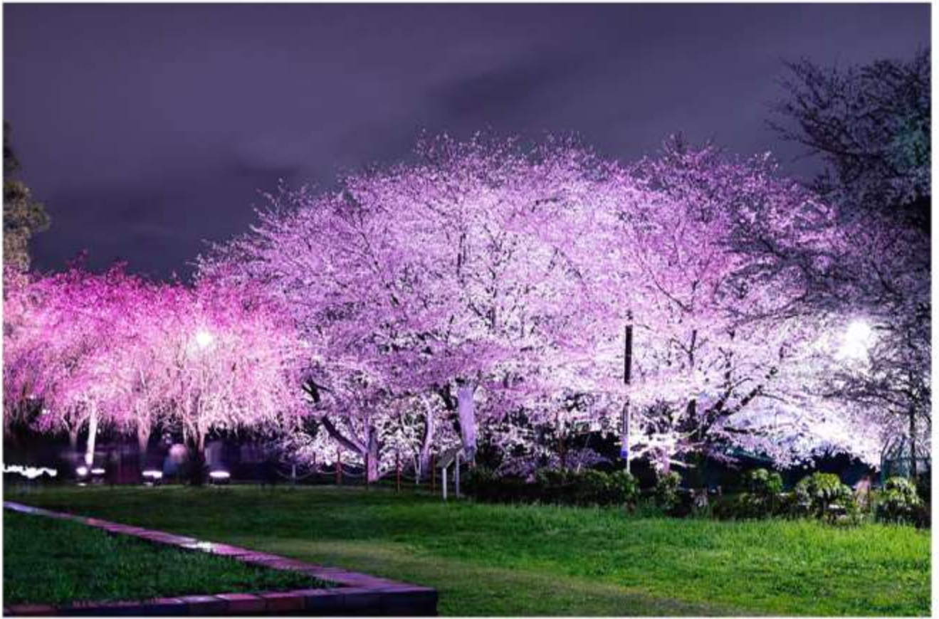
史跡武蔵国分寺跡 春のライトアップ