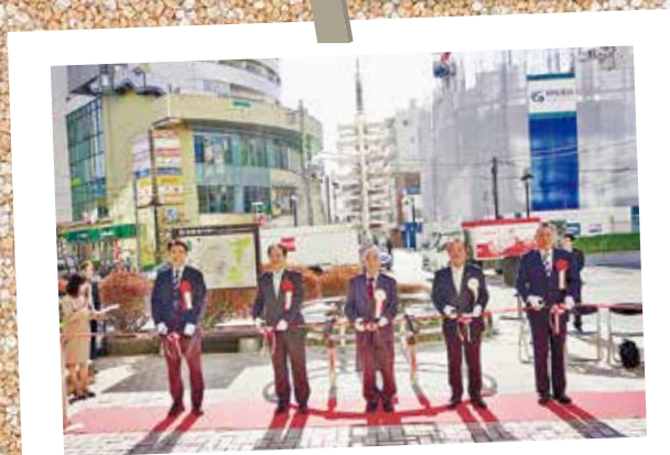
東京武蔵国分寺ロータリークラブから国分寺駅南口駅前七重塔モニュメントを寄贈いただきました