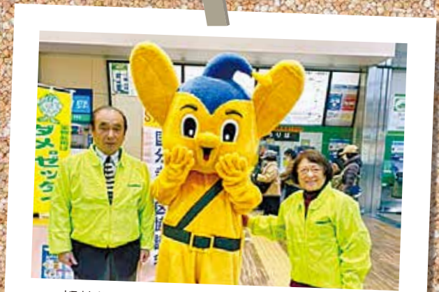
都薬物乱用防止推進国分寺地区協議会が12月14日に国分寺駅で啓発活動を行いました