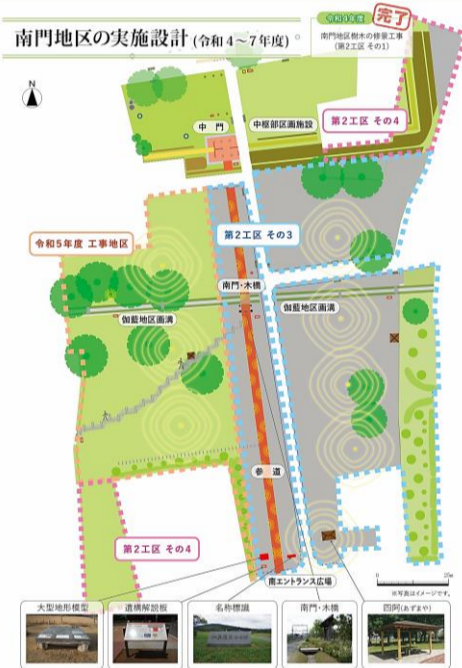
南門地区整備工事完成予定図 (令和5年度工事は西側です)

これまでに整備した武蔵国分寺跡の様子やこれからの計画は、『歴史公園ガイドブック』で見ることができます。左の二次元コードからもアクセスできます。