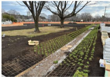
復原整備中の伽藍地区画溝 (南西から)

ふるさと文化財課では、貴重な歴史遺産として、国の史跡に指定されている武蔵国分寺跡を保存するとともに、歴史を学べる場、誰もが憩える場として後世に伝えるための公園づくりを行っています。現在進めている僧寺地区の事業は、平成15年度に開始し、これまで20年間にわたり計画策定や発掘調査、公園の設計・工事を継続して行ってきました。この工事では、武蔵国分寺の建物や附属施設が最も充実していた平安時代前期に焦点をあてて整備を行っています。