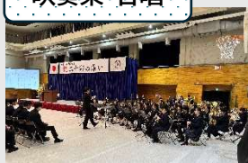
武蔵国分寺ジュニア・ミュージック・ソサエティ