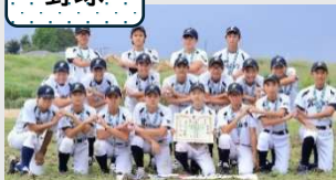
国分寺ベースボールクラブ