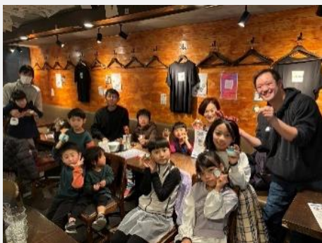
①子ども食堂スマイルプリン企画