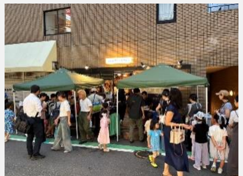
③トリシン子ども食堂夏祭りの様子

※掲載情報は令和7年3月時点のものです。変更される場合もありますので、詳細は各施設へお問い合わせください。