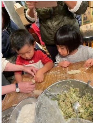
②トリシン子ども食堂の様子