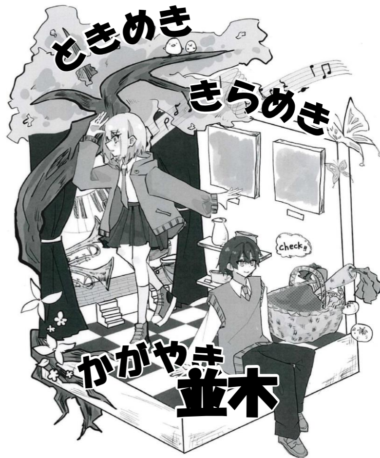
イラスト:国分寺高校イラスト文芸部