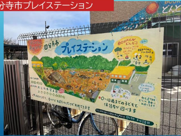
国分寺市プレイステーション