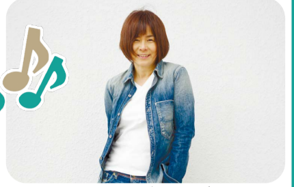
白井真子さん(シンガーソングライター)